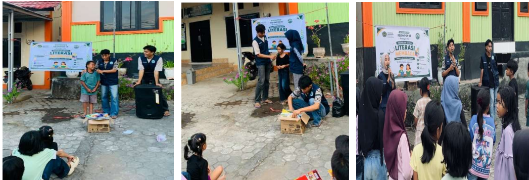
Gambar 1. Dokumentasi Literasi Menmbaca

Secara keseluruhan, program literasi membaca yang dilaksanakan di Desa Perigi berjalan dengan baik dan mendapat respons positif dari peserta. Tingginya antusiasme anak-anak selama kegiatan berlangsung menunjukkan bahwa pendekatan literasi yang dikemas melalui kegiatan membaca bersama dan permainan edukatif mampu meningkatkan ketertarikan peserta terhadap aktivitas membaca. Oleh karena itu, program serupa perlu terus dilaksanakan secara berkelanjutan sebagai upaya membangun budaya membaca sejak dini dan meningkatkan kemampuan literasi anak-anak di Desa Perigi.