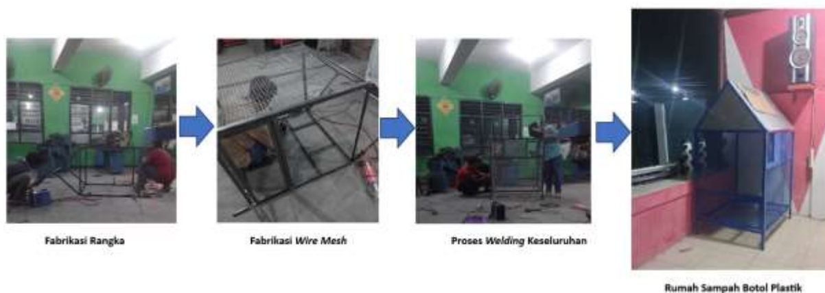
Gambar 2. Proses Fabrikasi Rumah Sampah Botol Plastik

Secara teknis, proses fabrikasi yang ditunjukkan pada Gambar 2. menunjukkan bahwa penggunaan material besi memungkinkan pembangunan struktur yang relatif sederhana namun kokoh, serta mudah dimodifikasi bila di kemudian hari dibutuhkan kapasitas lebih besar atau variasi bentuk lain. Pendekatan rekayasa sederhana seperti ini sejalan dengan praktik pengembangan produk fasilitas lingkungan di berbagai program pengabdian, di mana solusi yang dihasilkan harus mempertimbangkan ketersediaan material lokal, kemudahan pengerjaan, dan biaya yang terjangkau. Penggunaan dinding berongga memberi keuntungan tambahan berupa visibilitas dari rumah sampah plastik, yang dapat berfungsi sebagai media edukasi visual mengenai volume botol plastik yang dihasilkan komunitas.