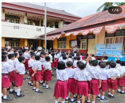
Gambar 1. Kegiatan Polsanak (Polisi Anak) Di SD Negeri 82 Dan SD Negeri 14 Ambon

Beberapa contoh gambar sosialisasi yang di lakukan Polresta Pulau Ambon dan P.P. Lease diantaranya yaitu :