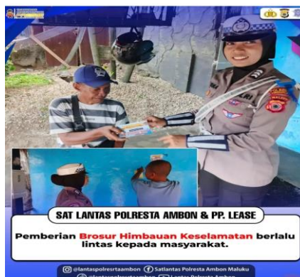
Gambar 5. Pemberian Brosur Himbauan Keselamatan lalu Lintas Kepada Masyarakat