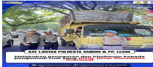
Gambar 9. Teguran Polresta Ambon Kepada Pengemudi Truk yang Odol