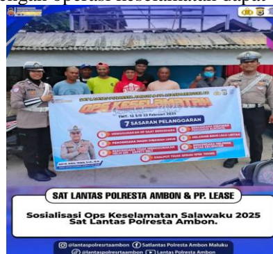
Gambar 4. Sosialisasi Operasi Keselamatan Salawaku 2025

Beberapa contoh gambar terkait dengan operasi keselamatan dapat dilihat pada halaman berikut ini :