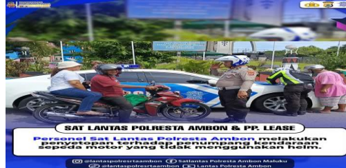
Gambar 10. Teguran Polresta Ambon Kepada Pengendara Yang Tidak Menggunakan Helm