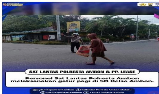
Gambar 7. Polresta Ambon Melakukan Gatur Pagi di SD Belso Ambon

Contoh gambar patroli yang dilakukan satlantas Polresta P. Ambon dan P.P. Lease di daerah rawan kecelakaan dapat dilihat di halaman berikut ini: