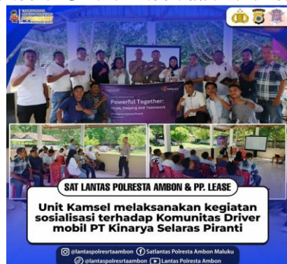
Gambar 3. Kegiatan Sosialisasi Komunitas Driver Mobil PT Kinarya Selaras Piranti