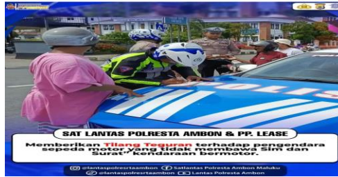
Gambar 8. Teguran Polresta Ambon Kepada Pengendara Yang Tidak Membawa Sim dan Surat Kendaraan