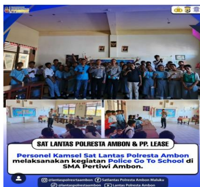
Gambar 2. Kegiatan Sosialisasi di SMA Pertiwi Ambon