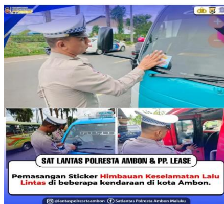
Gambar 6. Pemasangan Sticker Himbauan Keselamatan Lalu Lintas Di Beberapa Kendaraan Di Kota Ambon

Dari hasil wawancara yang dilakukan dengan beberapa anggota Polresta Pulau Ambon dan P.P. Lease, diketahui bahwa kampanye keselamatan lalu lintas yang telah dijalankan mendapat respons yang cukup positif. Ipda A. Kapitan menjelaskan bahwa kegiatan sosialisasi tersebut cukup berhasil karena banyak masyarakat yang hadir dan ikut aktif berdiskusi, meskipun pada akhirnya keberhasilan di lapangan sangat bergantung pada kesadaran masing-masing individu dalam berlalu lintas.