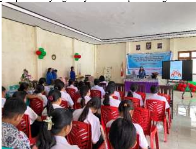
Gambar 2. Dokumentasi Kegiatan Penyampaian Materi dan Diskusi

Kegiatan diawali dengan pembukaan oleh perwakilan sekolah, dilanjutkan perkenalan tim pengabdian dan penjelasan singkat mengenai tujuan kegiatan. Penyampaian materi dilakukan secara interaktif dengan bahasa yang mudah dipahami siswa SMK, disertai contoh kasus nyata yang relevan dengan keseharian mereka, seperti ejekan di kelas, pengucilan dalam kelompok pertemanan, hingga perundungan melalui media sosial. Setelah pemaparan materi, dibuka sesi diskusi yang disambut antusias oleh siswa; banyak siswa yang secara spontan bertanya mengenai batasan antara bercanda dan bullying, serta cara menyikapi teman yang menjadi korban perundungan.