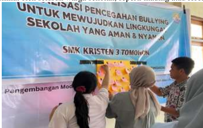
Gambar 3. Dokumentasi Kegiatan Deklarasi Anti-Bullying

Puncak kegiatan ditandai dengan deklarasi komitmen anti-bullying, di mana setiap siswa menuliskan pesan atau janji pribadi untuk tidak melakukan, membiarkan, atau menjadi korban diam dari tindakan bullying. Pesan-pesan tersebut ditulis pada media kertas kecil yang kemudian ditempelkan secara bersama-sama pada papan deklarasi yang telah disiapkan tim pengabdian dan selanjutnya dipasang di area yang mudah dilihat oleh seluruh warga sekolah, seperti mading atau lorong kelas.