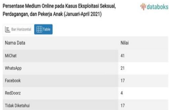
Gambar 2. Data KPAI tentang Aplikasi Eksploitasi Anak

Perkembangan modus prostitusi konvensional kepada prostitusi online juga melibatkan jaringan sosial dengan banyak aktor dalam bentuk operasional yang berbeda-beda sehingga sulit terdeteksi (Rahesli, 2023). Apabila ada permintaan akan PSK di bawah umur, maka para pelaku yang menjadi penghubung akan mencari sasaran anak dibawah umur yang mau menjual jasanya dengan imbalan tertentu. Untuk menghindari penelusuran lebih jauh, penghubung akan membuat jaringan baru yang terpisah dari PSK biasanya. Anak dibawah umur tidak akan dibiarkan menjual dengan sendirinya karena terhalang oleh undang – undang perlindungan anak. Maka dari itu, khusus untuk prostitusi anak lebih sulit untuk diselidiki karena membutuhkan banyak orang terlibat dalam prakteknya. Dalam hal jaringan komunikasi, bagi sebagian besar para pelaku dengan mempromosikan diri melalui media sosial dianggap dan dinilai lebih efektif menjajakan diri di media sosial daripada melakukannya secara offline.