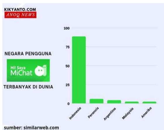
Gambar 1. Persentase 5 Negara Pengguna Michat Terbanyak Tahun 2024