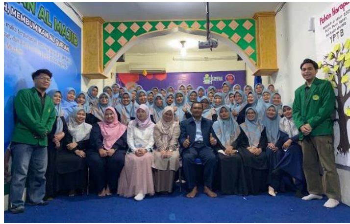
Gambar 4. Foto Bersama Pimpinan Yayasan, Relawan, dan Tim Pengabdian Masyarakat Universitas Muhammadiyah Jakarta

dengan pendampingan langsung dari fasilitator, efektif dalam meningkatkan keterampilan komunikasi para relawan.