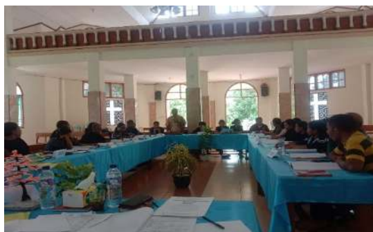
Gambar 2. Pelatihan dengan Presbiter dan Diskusi kelompok

Hasil ini secara langsung menjawab tujuan pengabdian, yaitu meningkatkan kompetensi hermeneutika presbiter dan menghasilkan modul penafsiran berbasis konteks lokal. Peningkatan signifikan menunjukkan bahwa pelatihan intensif dan kontekstual dapat menjembatani kesenjangan antara teori seminar dan praktik gereja (Thiselton, 2022). Di samping itu, pembentukan grup WhatsApp sebagai forum pendampingan menyediakan media berkelanjutan untuk berbagi materi, berkonsultasi, dan mendiskusikan tantangan interpretasi sehari-hari. Temuan bahwa 70% peserta awalnya hanya menggunakan Alkitab dan buku khotbah, serta 65% kesulitan teks asli (bahasa Ibrani/Kuno Yunani), menegaskan perlunya akses literatur teologis yang lebih luas dan pelatihan bahasa sumber. Ini sejalan dengan rekomendasi literature study groups yang dipraktikkan di beberapa gereja maju (J. Dunn, 2020).