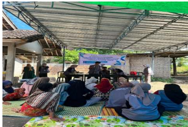
Gambar 3. Edukasi Pemasaran Online, meningkatkan kemampuan digital marketing untuk meningkatkan penjualan

Gambar dibawah ini merupakan kegiatan pemberian edukasi pemasaran secara online kepada masyarakat Desa Pandan Wangi.