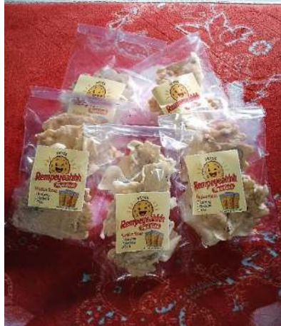
Gambar 4. Produk Rempeyeahhh yang gurih dan bikin nagih

Gambar diatas ini memperlihatkan rempeyek yang sudah matang dengan tektur yang crispy , rempeyek ini memiliki bentuk ramping dan ringan dengan cita rasa yang lezat serta aroma khas dari daun jeruk. Gambar ini juga menampilkan rempeyek yang telah dikemas dengan baik dan menarik. Produk rempeyek ini bisa dijadikan sebagai snack yang enak dan bergizi.