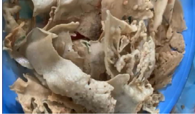
Gambar 2. Rempeyek yang gurih dan renyah

Gambar dibawah ini merupakan contoh olahan dari hail pertanian yaitu beras yang diolah menjadi rempeyek yang gurih dan renyah.