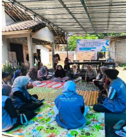
Gambar 1. Sosialisasi

Kegiatan sosialisasi produk rempeyek diatas diadakan untuk memperkenalkan produk rempeyek kepada masyarakat. Kegiatan ini dilakukan di Dusun Batu Bawi Desa Pandan Wangi dikediaman ibu kader pada 17 Mei 2025 jam 10.00 WITA yang di hadiri langsung oleh ibu-ibu PKK dan masyarakat setempat. Dalam kegiatan ini, dipamerkan berbagai jenis rempeyek dengan varian rasa yaitu kedelai, kacang, dan teri. Dalam kegiatan ini juga, dilakukan pengenalan produk secara detail, mencakup spesifikasi produk, keunggulan kompetitif, dan target pasar. Selain itu, dipaparkan pula peran strategis teknologi digital sebagai alat pemasaran modern. Penjelasan mencakup berbagai platform digital yang relevan, strategi pemasaran digital yang efektif, dan manfaat penggunaan teknologi digital dalam meningkatkan visibilitas produk, menjangkau pasar yang lebih luas, serta menciptakan interaksi yang lebih efektif dengan konsumen. Penjelasan juga mencakup aspek praktis penggunaan teknologi digital dalam pemasaran, seperti pembuatan konten pemasaran yang menarik, pengelolaan media sosial, dan analisis data pemasaran untuk evaluasi dan optimasi strategi.