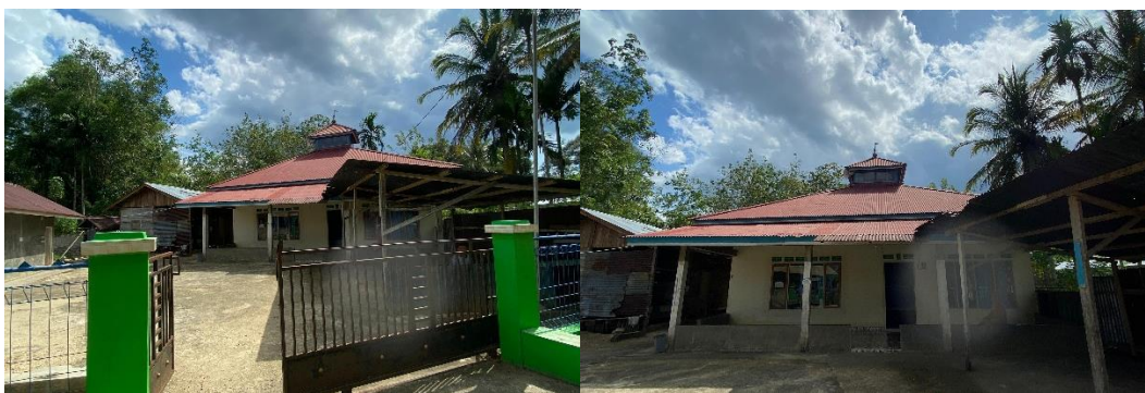
Gambar 01. TPQ/TPSQ Surau Baitul Khairat

TPQ/TPSQ Surau Baitul Khairat rutin mengadakan kegiatan pembelajaran setiap sore hari mulai pukul 15.30 hingga 17.00 WIB. Jadwal ini ditetapkan dengan pertimbangan agar anak-anak terlebih dahulu menunaikan salat Ashar dan tidak terganggu dengan aktivitas lain, seperti sekolah daring di pagi hari atau waktu bermain keluarga di siang hari. Pemilihan waktu sore hari bertujuan untuk melatih anak-anak dalam manajemen waktu yang seimbang serta menanamkan kedisiplinan dan tanggung jawab.