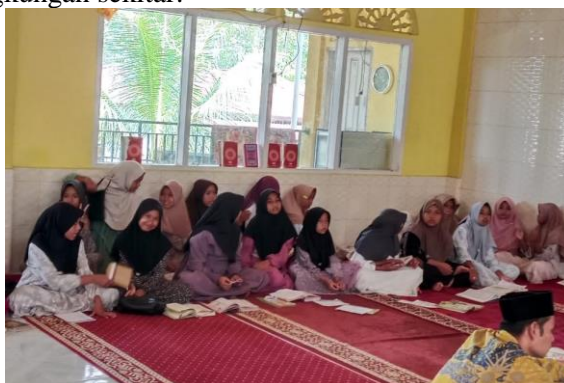
Gambar 03. praktik di TPQ/TPSQ Surau Baitul Khairat penanaman nilai-nilai moderasi

Dalam mengimplementasikan nilai moderasi beragama, penting juga untuk mengadopsi pendekatan dan media pembelajaran yang inovatif, kreatif, dan menyenangkan agar dapat diterima oleh anak-anak tanpa adanya pemaksaan (Mardiyah & Rozi, 2019). Strategi ini juga menjadi bentuk preventif terhadap berkembangnya pemahaman radikal yang bisa saja masuk ke dalam pemikiran anak melalui media digital atau lingkungan sekitar.