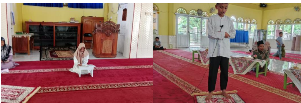
Gambar 02. Setoran hafalan bacaan Al-qur'an dan bacaan Sholat

Kegiatan pembelajaran dimulai dengan pembacaan doa bersama yang dipimpin oleh ustadzah atau salah satu santri secara bergiliran. Pembacaan doa sebelum belajar mengajarkan nilai spiritualitas dan kesadaran akan kehadiran Allah dalam setiap aktivitas belajar. Setelah itu, santri akan mengantri untuk menyetorkan hafalan atau bacaan Iqra dan Al-Qur'an sesuai dengan level kemampuan mereka. Dalam praktik ini, kerap kali terjadi desakan antar santri saat antri, sehingga menjadi momentum penting untuk menanamkan nilai keadilan ( i'tidal ) dan kesabaran dalam menunggu giliran. Sikap ini juga menumbuhkan karakter toleransi dalam konteks yang konkret di lingkungan belajar mereka (Arifin, Sugiono, & Hakim, 2021).