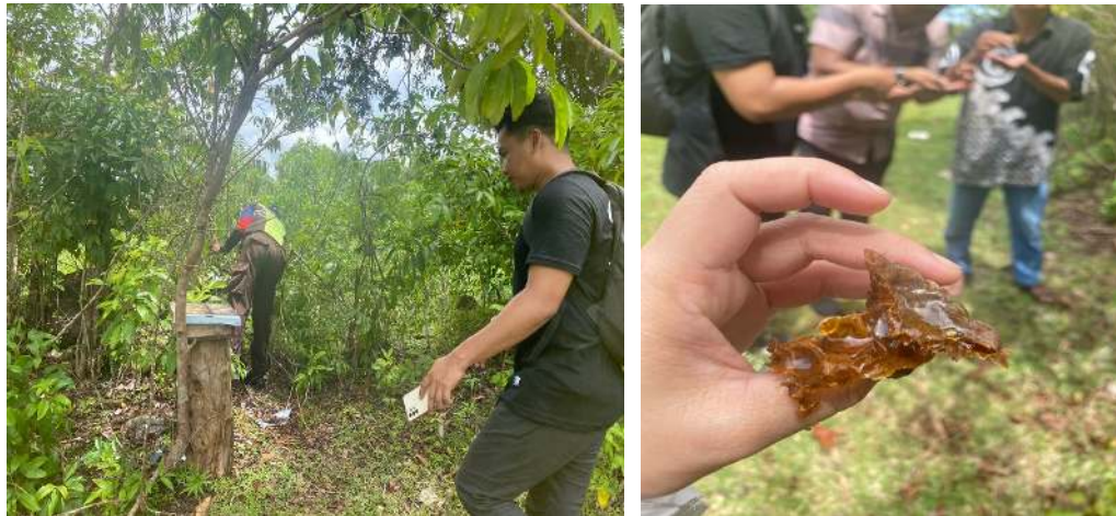
Gambar 2. Proses Pengambilan Madu

Propolis, Madu dan Roti lebah dipanen dengan membuka penutup atas bagian dalam kotak kayu yang sudah di buat sedemikian rupa yang berisi sel-sel cadangan pakan. Madu dan Roti lebah dikeluarkan dari sel-sel penyimpanan. Sel-sel penyimpanan yang terisi dicetak menjadi lempengan-lempengan membulat lalu diekstraksi untuk mendapatkan propolisnya.