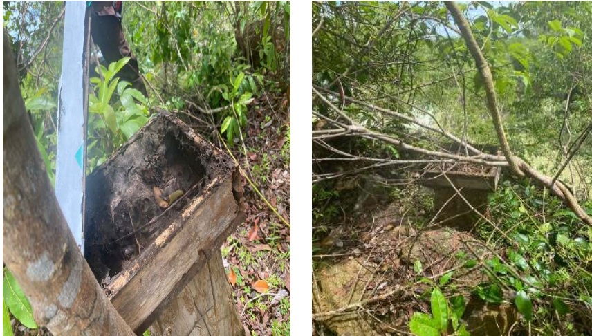
Gambar 1. Tempat Penangkaran Lebah Trigonal di Pesantren Jabal Uhud

Lebah trigona menyimpan madunya didalam propolis yang berbentuk bulat memanjang, dengan volume 5 sampai 10ml. Proses pemanenan madu dapat dilakukan ketika propolis sudah tertutup rapat. Umumnya panen dapat dilakukan secara setiap 1 bulan sekali