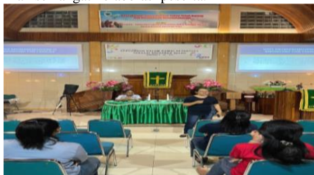
Gambar 3. Diskusi Kelompok Dalam Kegiatan Pendampingan UMKM AMGPM

Selain penguatan keterampilan ekonomi, kegiatan ini juga mempererat solidaritas dan rasa tanggung jawab sosial di antara anggota AMGPM. Foto di bawah ini menampilkan sesi diskusi kelompok yang menunjukkan semangat kolaborasi peserta.