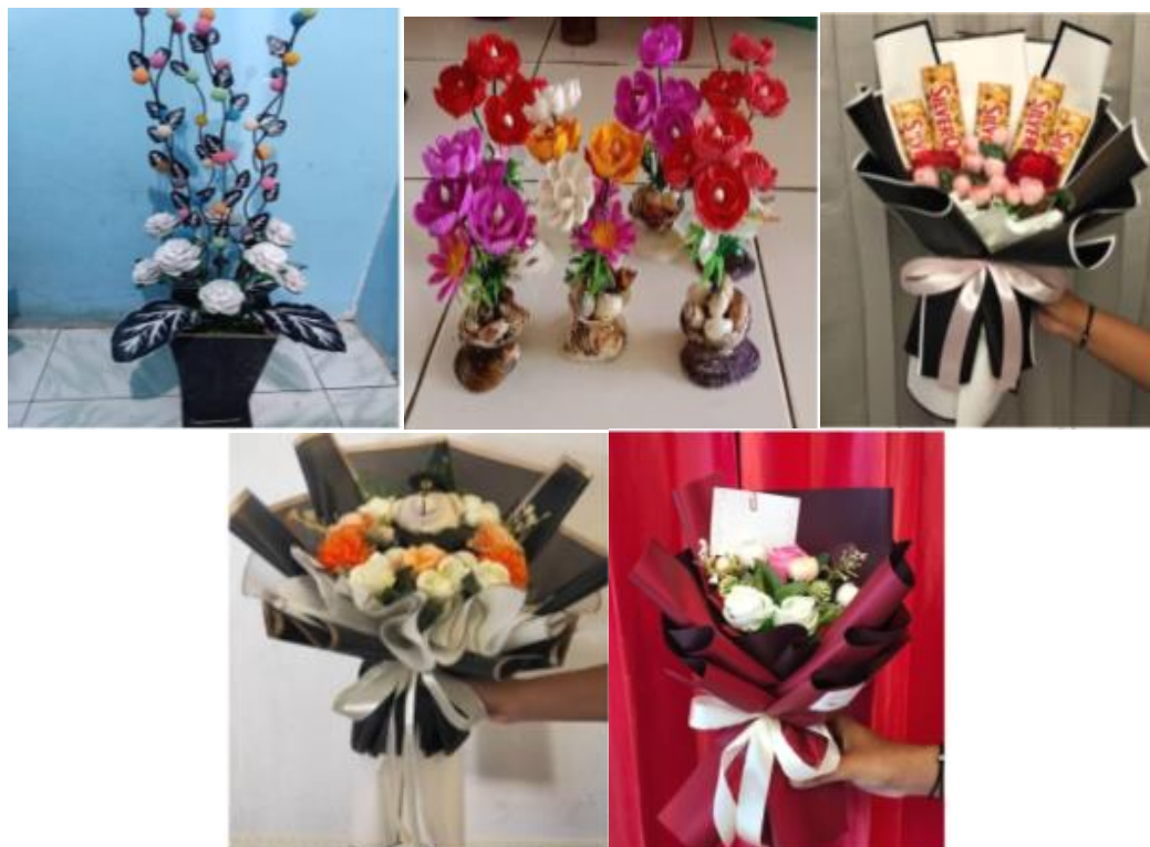
Gambar 2. Produk Hasil Pelatihan UMKM Kreasi AMGPM