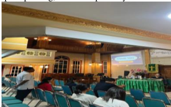
Gambar 1. Suasana Pelatihan Kewirausahaan Yang Diikuti Oleh Anggota AMGPM.

Hasil pre-test menunjukkan bahwa sebagian besar peserta belum memiliki pemahaman yang utuh tentang konsep dasar kewirausahaan. Namun, setelah pelatihan, hasil post-test menunjukkan peningkatan rata-rata skor sebesar 60%. Ini mencerminkan bahwa peserta mulai memahami pentingnya berpikir kreatif, berorientasi pada peluang, serta mampu menyusun rencana usaha sederhana.