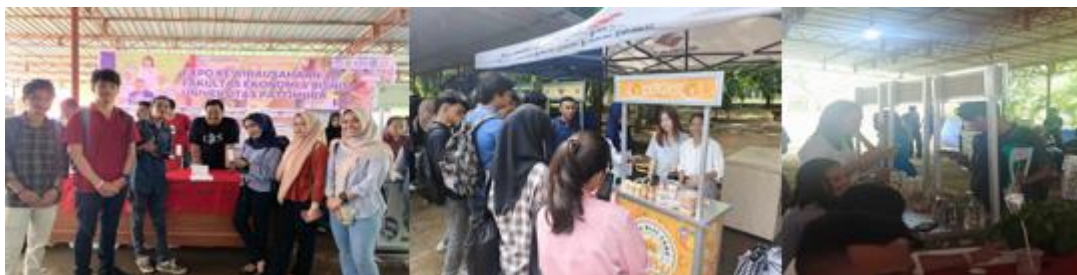
Gambar 4. Diskusi Kelompok Mahasiswa Membahas Strategi Pengembangan Usaha

Secara keseluruhan, kegiatan expo kewirausahaan ini berhasil menjembatani teori kewirausahaan yang diperoleh di bangku kuliah dengan praktik nyata di lapangan. Dengan demikian, program “Wirausaha Muda Bangkit” mampu menumbuhkan jiwa entrepreneurship dan meningkatkan minat usaha mahasiswa Universitas Pattimura secara signifikan.