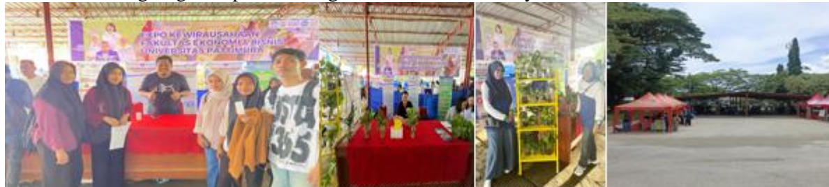
Gambar 1. Suasana Pembukaan Ekspo Wirausaha Muda Bangkit

Pelaksanaan kegiatan ekspo kewirausahaan inovatif di Universitas Pattimura selama dua minggu menunjukkan hasil yang sangat positif dalam meningkatkan minat berwirausaha mahasiswa. Data kuesioner dari 50 peserta mengindikasikan adanya peningkatan minat berwirausaha sebesar 35% setelah mengikuti rangkaian kegiatan yang meliputi pelatihan, pendampingan, dan pelaksanaan ekspo. Peningkatan ini menegaskan bahwa keterlibatan aktif mahasiswa dalam mempromosikan dan menjual produk secara langsung mampu membangkitkan motivasi dan keyakinan mereka untuk memulai usaha.