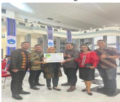
Gambar 5. Penutupan Dan Evaluasi Kegiatan Expo Dengan Seluruh Peserta Dan Panitia

Secara keseluruhan, kegiatan expo kewirausahaan ini berhasil menjembatani teori kewirausahaan yang diperoleh di bangku kuliah dengan praktik nyata di lapangan. Dengan demikian, program “Wirausaha Muda Bangkit” mampu menumbuhkan jiwa entrepreneurship dan meningkatkan minat usaha mahasiswa Universitas Pattimura secara signifikan.