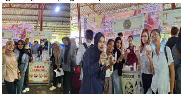
Gambar 3. Mahasiswa Mempresentasikan Produk Mereka Kepada Pengunjung

Observasi selama kegiatan juga memperlihatkan antusiasme tinggi dari mahasiswa dalam menyiapkan stan dan berinteraksi dengan pengunjung ekspo, termasuk pemanfaatan media sosial sebagai sarana promosi yang memperluas jangkauan pasar.