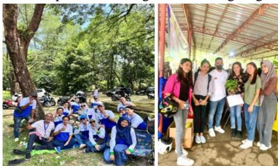
Gambar 2. Sesi Pendampingan Mentor Dengan Mahasiswa

Pelatihan dan pendampingan yang diberikan oleh mentor berpengalaman terbukti sangat efektif dalam membantu mahasiswa mengembangkan produk serta strategi pemasaran yang lebih inovatif dan tepat sasaran. Peserta mengungkapkan bahwa mereka merasa lebih percaya diri dan siap menghadapi tantangan dunia bisnis setelah mendapatkan bimbingan secara langsung.