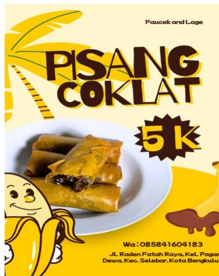
Gambar 4. Pamflet Open Preorder Piscok.

Secara keseluruhan, proses pembuatan piscok (pisang coklat) berjalan tanpa hambatan. Langkah selanjutnya yang diambil oleh tim adalah melakukan promosi penjualan melalui sistem Open Preorder yang dijadwalkan siap pada tanggal 10 Maret 2025. Produksi piscok (pisang coklat) sendiri dilaksanakan pada tanggal 9 Maret 2025. Promosi dilakukan dengan menyebarkan pamflet di berbagai platform media sosial, yang berupa gambar pamflet produk. Dari kegiatan promosi dan preorder tersebut, tim berhasil mendapatkan 10 porsi pesanan, dengan harga jual setiap porsinya adalah 5 ribu rupiah. Tahap akhir dari kegiatan ini adalah mengantarkan pesanan piscok kepada masing-masing pembeli pada tanggal 10 Maret 2025.