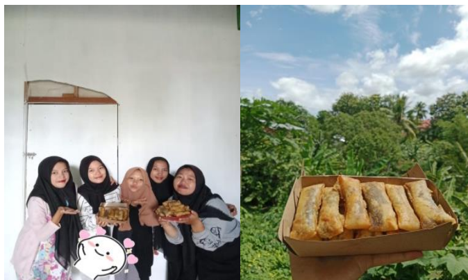
Gambar 6. Dokumentasi hasil produk piscok.