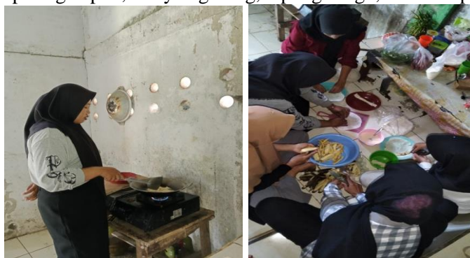
Gambar 1. Proses Pembuatan Piscook (Pisang Coklat).

Secara ringkas, tahapan pembuatan beserta alat dan bahan yang digunakan dalam pembuatan Piscook (pisang coklat) akan disajikan dalam gambar 1, 2, 3, 4, 5, 6, 7. Alat-alat yang dibutuhkan antara lain kompor, wajan, wadah, saringan, kotak kemasan piscook, dan nampan. Sementara itu, bahan-bahan yang diperlukan adalah pisang kepok, minyak goreng, tepung terigu, kulit lumpia, dan meses.