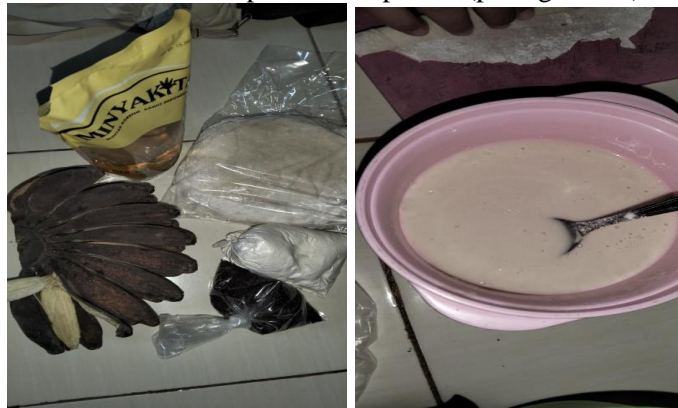
Gambar 3. Bahan pembuatan piscok (pisang coklat).

Secara keseluruhan, proses pembuatan piscok (pisang coklat) berjalan tanpa hambatan. Langkah selanjutnya yang diambil oleh tim adalah melakukan promosi penjualan melalui sistem Open Preorder yang dijadwalkan siap pada tanggal 10 Maret 2025. Produksi piscok (pisang coklat) sendiri dilaksanakan pada tanggal 9 Maret 2025. Promosi dilakukan dengan menyebarkan pamflet di berbagai platform media sosial, yang berupa gambar pamflet produk. Dari kegiatan promosi dan preorder tersebut, tim berhasil mendapatkan 10 porsi pesanan, dengan harga jual setiap porsinya adalah 5 ribu rupiah. Tahap akhir dari kegiatan ini adalah mengantarkan pesanan piscok kepada masing-masing pembeli pada tanggal 10 Maret 2025.