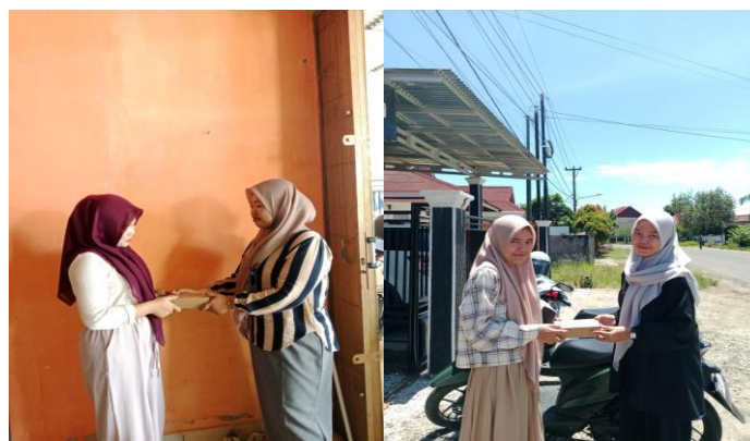
Gambar 5. Bukti pengantaran produk kepada konsumen.