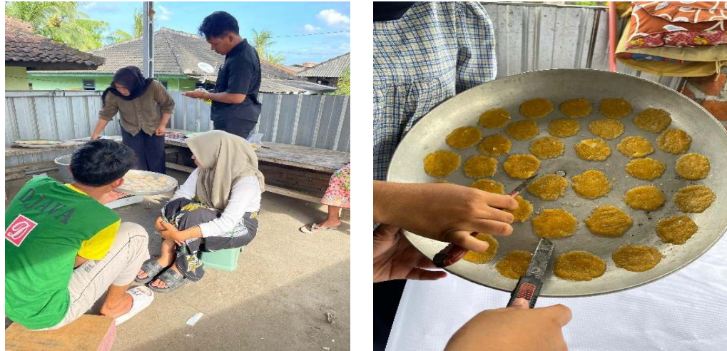
Gambar 6. Pengukusan adonan Opak Singkong