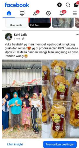
Gambar 10. Pemasaran Opak Singkong.

Tahapan Pasca Produksi merupakan tahap pemasaran produk dan evaluasi dari semua rangkaian tahapan kegiatan produksi. Pemasaran dilakukan secara langsung dengan cara menitipkan ke warung dan kantin sekolah juga dilakukan pemasaran melalui media sosial dengan memanfaatkan Facebook dan WhatsApp .