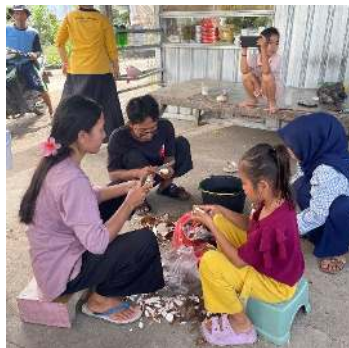
Gambar 2. Memilih, mengupas dan membersihkan singkong.