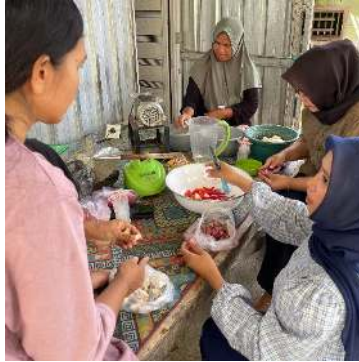
Gambar 3. Menghaluskan singkong dan rempah-rempah serta bumbu.