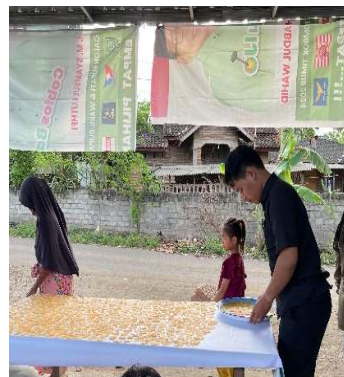
Gambar 7. Penjemuran Opak Singkong.