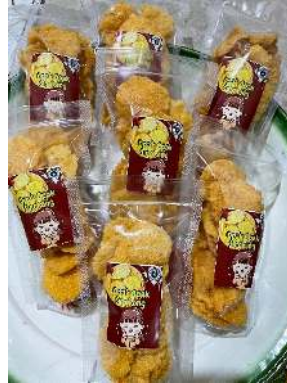
Gambar 9. Pengemasan Opak Singkong.