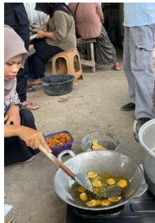
Gambar 8. Penggorengan Opak Singkong.