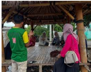
Gambar 1. Sosialisasi pemanfaatan sumberdaya lokal dan produksi Opak Singkong

Setelah melakukan uji coba produk, tim melakukan edukasi dan sosialisasi langsung kepada masyarakat dengan sasaran ibu-ibu rumah tangga. Kegiatan sosialisasi dilakukan dengan memaparkan bagaimana cara pemanfaatan sumberdaya lokal, bagaimana produksi Opak Singkong, dan Pemasaran Opak Singkong. Setelah melakukan sosialisasi, tim membentuk kelompok produksi Opak Singkong dari peserta sosialisasi dan menetapkan tempat pembuatan atau produksi Opak Singkong.