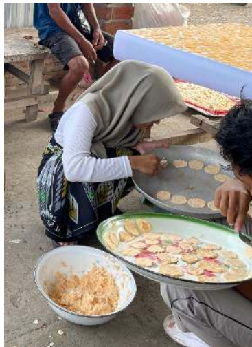
Gambar 5. Pencetakan adonan Opak Singkong.