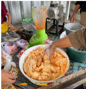
Gambar 4. Mencampur adonan.