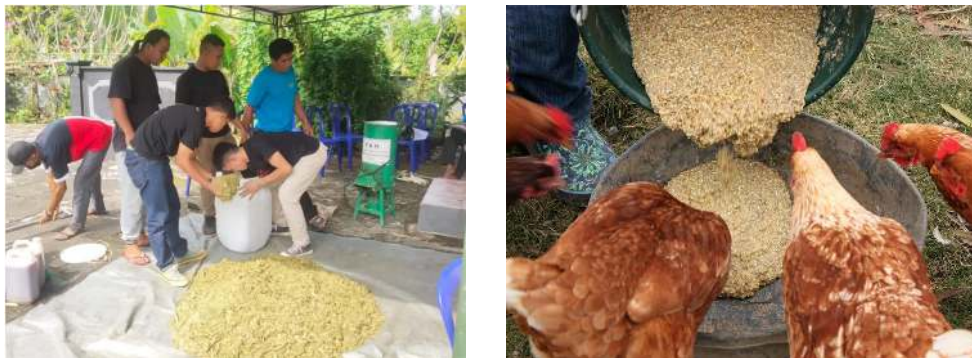
Gambar 1. Kegiatan Pembuatan Pakan Ternak Ayam Kampung

Sedangkan untuk pelaksanaan kegiatan praktikum pembuatan pakan ayam kampung dapat dilihat pada gambar 1 dibawah ini: